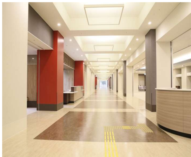
【外来のホスピタルモール】